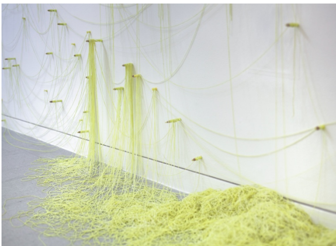
obliquely.installation view 01 | 2023