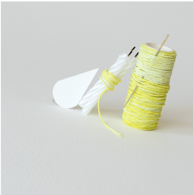
obliquely_15 | 500x500 | Archival pigment print | 2024