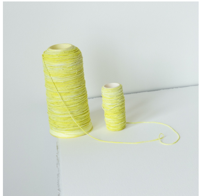
obliquely_17 | 350x350 | Archival pigment print | 2024