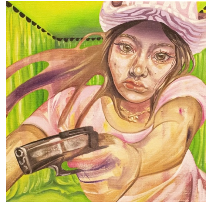
ミス・グリーンバック | キャンバス、油彩 | 2023 | 333×333

自己の内面にある「箱庭」をモチーフに、その中で繰り広げられる登場人物達の掛け合いをスナップ写真的に切り取り絵画にしています。