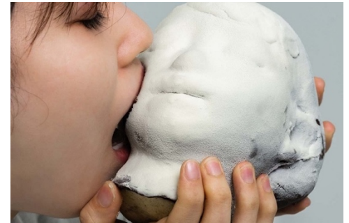
eat a star | チョコレート、ホワイトチョコレート、ココナッツバター、生クリーム、スポンジ、イチゴ | 2021 | 155×180×200

洋菓子店で育ったバックグラウンドから主に洋菓子を素材にした彫刻、パフォーマンスを制作。鑑賞体験を、見るだけでなく食べるという、香りや味、食感といったアプローチに拡張する、食べる彫刻 (eat sculpture) をつくる。