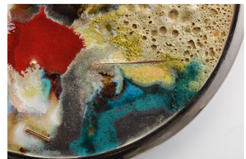
ゆらぎ | 磁器土、釉薬、金、プラチナ | 2024 | 280×270×70

ドローイングによって部分的に抽出した営みの形象を陶立体へと変換し、再構築していく中で一つ一つに物語を込めている。