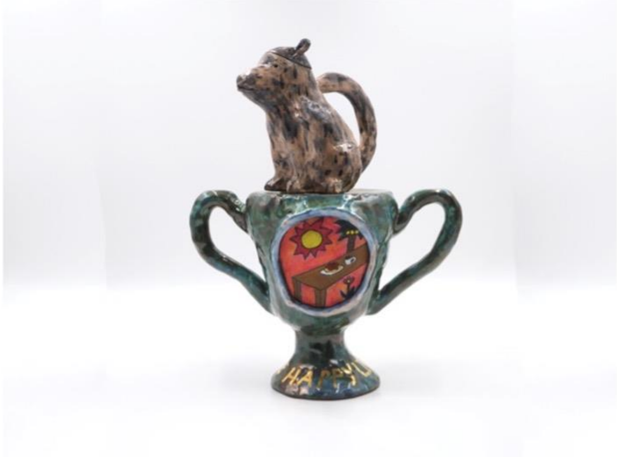
みち | 陶、塩、薬 | 2024 | 300×150×750