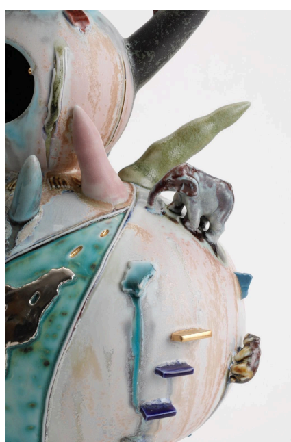
《幽けき棲処》 磁土、釉薬、金、プラチナ | 565×260×170 mm